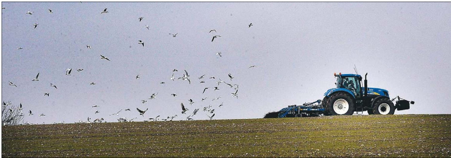
Skal man se plovmand, skal man kigge ud på markerne. I landmandens tegnebog er der ingen. Økonomien er igen gået i nul eller under.

SEOUL: Overskuddet hos verdens største smartphone-producent, Samsung, er mere end halveret i løbet af bare 12 måneder. Elektronikgigantens driftsoverskud i tredje kvartal vil være 60 procent lavere end i samme periode sidste år.